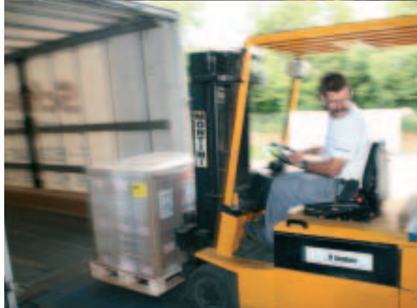
Die Nähe zum Grenzzoll sowie die Umschlags- und Zwischenlagermöglichkeiten erleichtern die flexible und speditive Abwicklung der Zollformalitäten.

Mit der Europlattform steht unseren Kunden ein multifunktionales Lager- und Distributionsterminal zur Verfügung, ideal für alle Arten von Lagerhaltung und Kontraktlogistik, geeignet als Transit- und Zollfreilager sowie als zentrale Plattform für die Warendistribution in Europa. Unser Team vor Ort stellt die gewünschten Dienstleistungen nach den Wünschen unserer Kunden zu einem massgeschneiderten Angebot zusammen.